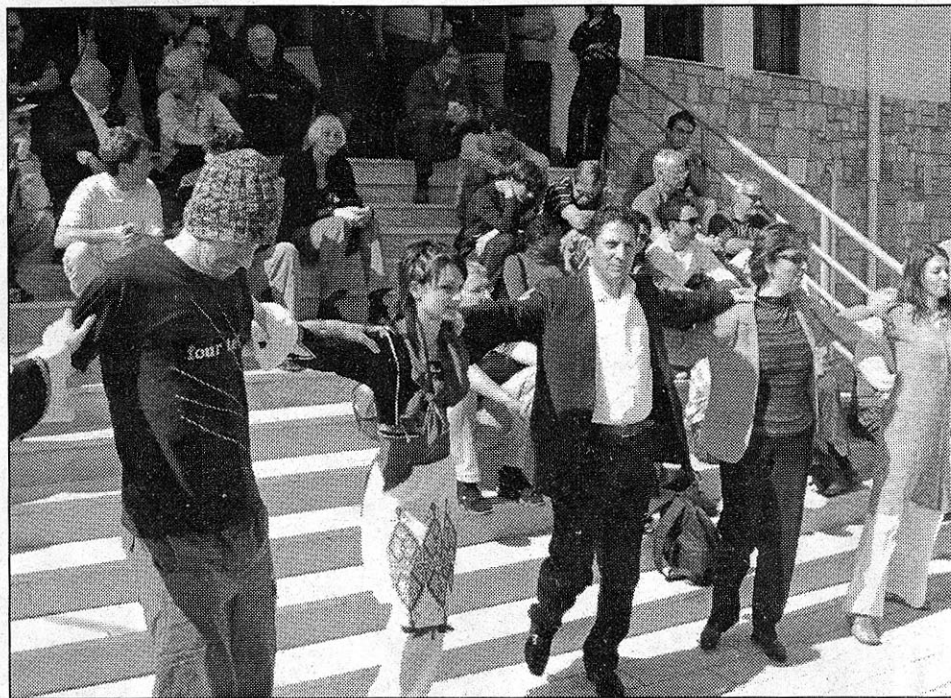
Ο δήμαρχος Αγίας Βαρβάρας «εκπαιδεύει» τους επισκέπτες - επιστήμονες στους κρητικούς χορούς.

Στην Ελλάδα, αρκετές περιοχές αντιμετωπίζουν το προαναφερθέν πρόβλημα. Στην Κρήτη, έχουν καταδειχθεί προβληματικές ως προς αυτή την κατεύθυνση, οι ανα-