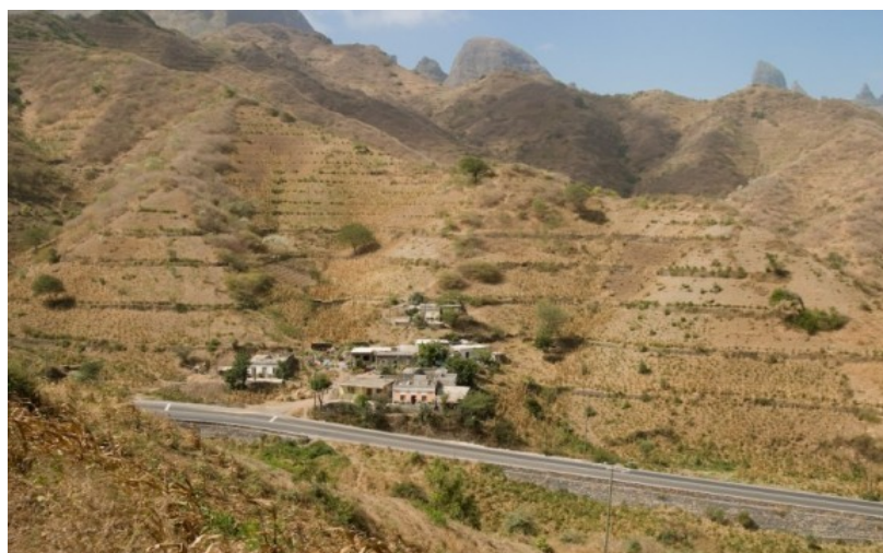
Culture de maïs en terrasse, en association avec les haricots et les petits pois, île de Santiago, Cap-Vert (Janvier 2008)

Avec une pluviométrie annuelle de 300 mm et une superficie de 23 000 ha de terre arable sur des terrains très escarpés, les ressources naturelles de la plus grande île agricole, Santiago (sur la côte ouest de l'Afrique) doivent être utilisées de manière judicieuse. L'investissement dans la préservation du Les pentes arides sont cultivées en terrasse dès que cela est possible pour faire pousser du maïs et différents haricots (et petits pois) sur les tiges de maïs, aliments de base des insulaires. En 2000, 30 % de la population nationale était en dessous du seuil de pauvreté ; c'est pourquoi