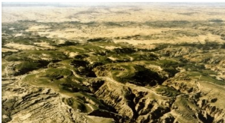
Marques de l'érosion sur le plateau de Loess, en Chine