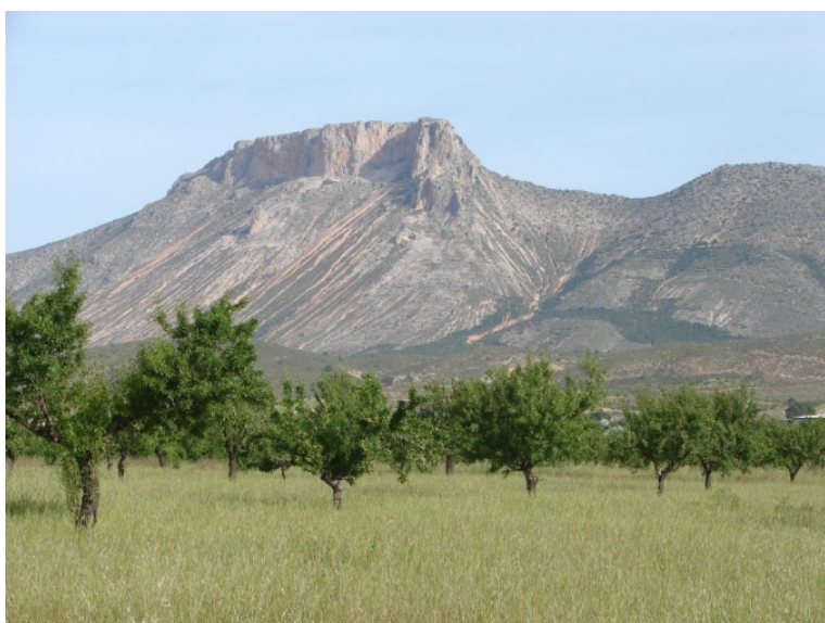
Champ d'amandiers et compost, dans la partie centrale du bassin Guadalentín, SE Espagne (Mai 2007)

Ici, l'érosion des sols et la pénurie en eau sont fréquentes et particulièrement liées au labour ou à l'abandon des terres. Le sol est fortement sujet à l'érosion, à tel point que dans ce climat semi-aride, des tempêtes provoquent souvent la formation de rigoles et de ravins. Les parties prenantes sont d'accord pour essayer de mettre en place des mesures permettant d'accroître l'infiltration et la teneur en eau dans le sol, telles que le travail minimum de la terre, le paillage et la récupération des eaux d'inondation. Les ruissellements et l'érosion peuvent être réduits grâce au recours aux terrasses et aux bandes de végétation ou au paillage. Le paysage devrait être évalué et organisé pour fournir une mosaïque d'utilisations intégrées ; on pourrait s'orienter vers des produits certifiés de haute qualité, notamment de l'agriculture biologique. Localement, la teneur du sol en nutriments devrait être enrichie de lisier provenant des porcheries voisines.