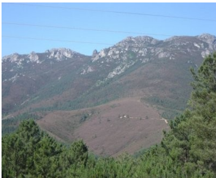
Le bassin versant de Vale Torto, à Góis au Portugal (en arrière-plan) sert à recueillir l'érosion des sols avant et après les feux dirigés.