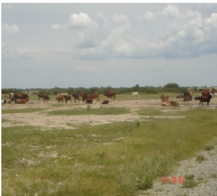
Pâturage dans la région de Boteti, au Botswana (Février 2008)

L'agro-pastoralisme de subsistance persiste dans la région malgré le climat semi-aride. Les sécheresses sont endémiques à Boteti, avec un intervalle de récurrence estimé à 10-18 ans. La région est connue pour être un archétype de la dégradation des terres due à l'érosion éolienne de la saison sèche et du surpâturage. Pour sauvegarder les modes de vie dépendant de la terre, depuis 2002, le Gouvernement et le Programme des Nations unies pour l'environnement ont uni leurs forces pour promouvoir la conservation de la terre et de la végétation indigène en s'appuyant sur la communauté. Parmi les stratégies participant à la diversification de l'économie et la réduction de la pauvreté figurent la récupération des eaux de surface, l'installation de l'énergie solaire, l'élevage en ranch, et la production et l'utilisation de biogaz. Les communautés locales ont choisi la production de biogaz pour le pilotage du projet à cause de son potentiel pour préserver la végétation et pour promouvoir un commerce de boulangeries à petite échelle.