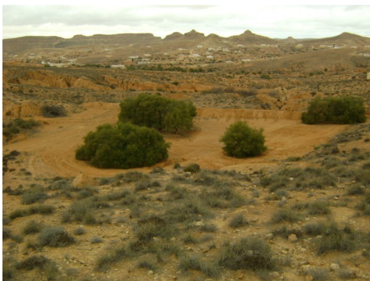
Terres de pâturage à Zeus Koutine, en Tunisie (Janvier 2009)

Ici, les problèmes de la dégradation des terres sont le résultat de changements historiques au niveau de leur affectation. Les anciennes terres tribales qui étaient utilisées pour le pâturage ont été privatisées et exploitées surtout pour des cultures d'irrigations et pluviales, notamment les arbres fruitiers. La compétition pour les ressources naturelles, surtout l'eau, s'est accrue. De nouveaux projets de conservation de l'eau et de la terre et de réhabilitation des terres de pâturage existent. Des stratégies vont être expérimentées et évaluées, particulièrement pour déterminer quelles stratégies sont acceptables par les parties prenantes locales.