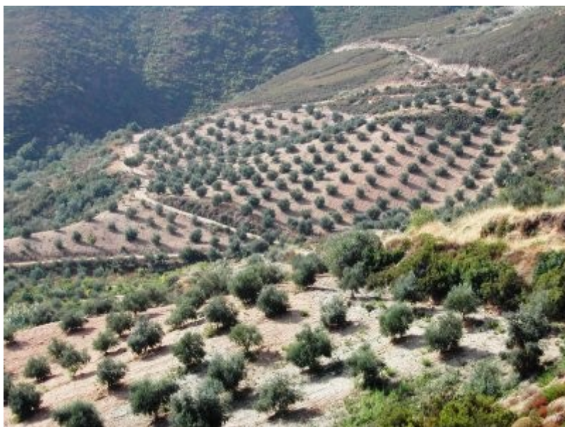
Oliveraie à Chania en Crète.