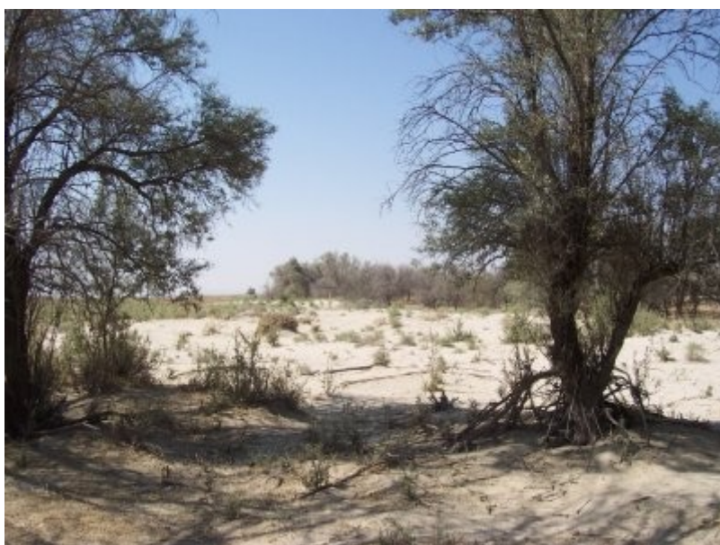
Colonisation d'arbres sur des dunes de sables à Karapinar en Turquie.

L'érosion éolienne est le principal problème du lieu, au niveau des sédiments restant d'un ancien lac peu profond. Les céréales et la betterave à sucre représentent les principales cultures. Différentes stratégies d'irrigation et de protection des sols ont été essayées dans le passé, certaines efficaces, d'autres non. Les stratégies seront revues et des améliorations proposées : le pâturage tournant, la culture en bandes et l'irrigation goutte à goutte, notamment, seront testés.